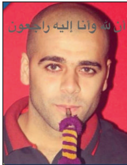
ان س وانا إليه راجعون

وهو شاب عربي ايضا من يافا حالته وصفت بالمتوسطة جنبا الى جنب مع اصابة سائق السيارة وهو عربي في العشرينات من عمره بجروح طفيفة أحيلا على اثرها للعلاج في المستشفى.