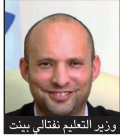
وزير التعليم نفتالي بينت

ولد يتبع لعنقود اجتماعي اقتصادي 1 يقوم بدع رسوم 50 شاقل فقط. والاطار يشمل وجبة ساخنة بمستوى عال ، 2 دورات لكل طالب ومراقبة وتفتيش مهني. والتكلفة تتغير حسب الانتماء للعنقود الاجتماعي - الاقتصادي "و. زاد البيان: "وقال وزير التعليم، نفتالي بينت: "نويديات الظهيرة هي بشري للأهل وللأولاد. الحديث يدور عن توفير يقدر بمئات الشواقل لكل عائلة. وحل لأهل الذين يريدون أن يعملوا حتى الساعة الرابعة بهدوء. لأن أبنائهم سيكونون في اطار تربوي آمن. أشد على أيدي صديقي وزير المالية الذي سعى معي لتحقيق هذا