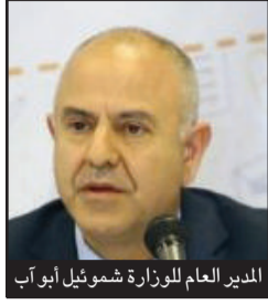
وزير التعليم نفتالي بينت

جدول التكلفة وفق التوزيع الاقتصادي الاجتماعي في كل الدولة وفي جميع الأوساط . الحديث يدور عن بشري فعلياً .