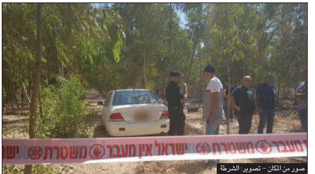
صور من المكان

الشبهات الجنائية من وراء وفاة السيدة المرحومة"، بحسب الشرطة. وزادت السمري: "هذا وبطبيعة الحال من المقرر الغاء أمر حظر النشر، الذي كان قد تم فرضه على مجريات التحقيقات في ملف هذه القضية"، إلى هنا بيان الشرطة.